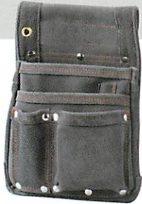
GK-102 釘袋 仮枠 SIZE (約) H340×W260mm JAN 4533707 50129 8