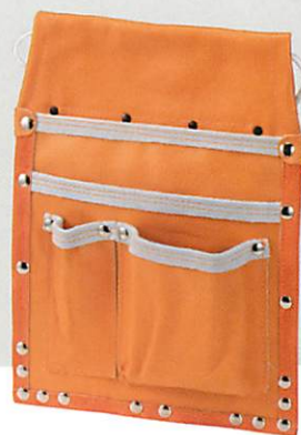
NO-311 エバー仮絆紙止め釘袋 SIZE (約) H380×W280mm JAN 4533707 50025 3