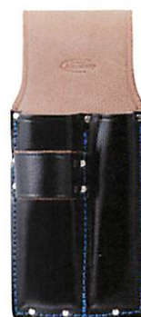
BL-53 ノミ・玄能ケース2丁差 SIZE(約)H255×W115×65mm JAN 4533707 80055 1