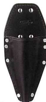
GR-032R 万能剪定鋏ケース SIZE (約) H230×W100×D40mm JAN 4533707 80151 0