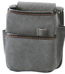
GK-201 電工袋2段 SIZE (約) H235×W190×D120mm JAN 4533707 50133 5