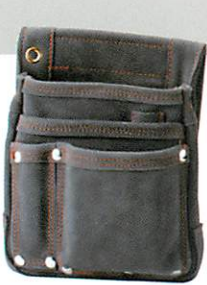
GK-101 釘袋 棟梁タイプ 小 SIZE (約) H280×W230mm JAN 4533707 50128 1