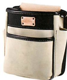
DM-10 デルマ革 電工袋2段 SIZE (約) H230×W190×D120mm JAN 4533707 50180 9