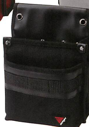
PKS-270 BK ブラック JAN 4533707 60176 9