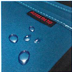
雨や汚れに強い撥水コーティング。