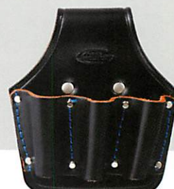
BL-73 ペンチ7吋3丁差 SIZE (約) H145×W135×D35mm JAN 4533707 80044 5