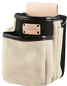
DM-11 デルマ革 ミニポケ SIZE (約) H210×W135×D120mm JAN 4533707 50181 6