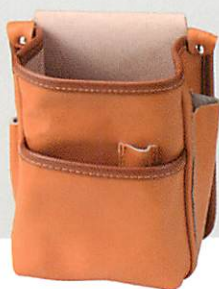
NO-301 エバー電工袋2段 SIZE (約) H230×W190×D120mm JAN 4533707 50011 6