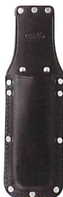
GR-015R 万能ツール差 SIZE (約) H285×W80×D35mm JAN 4533707 80146 6