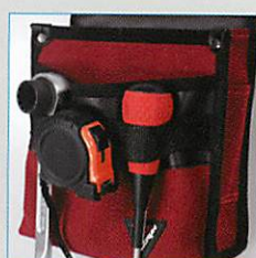
収納力さらにアップ! 差し込みフックテープ。