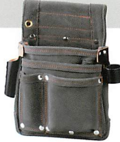
GK-103 釘袋 仮枠 工具差付 SIZE (約) H340×W310mm JAN 4533707 50130 4