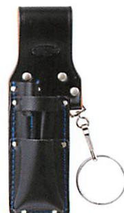
BL-22 ハッカー2丁差 カン付 SIZE (約) H225×W80×D45mm JAN 4533707 80049 0