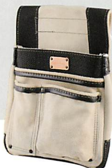
DM-02 デルマ革 釘袋 大 SIZE (約) H350×W250mm JAN 4533707 50176 2