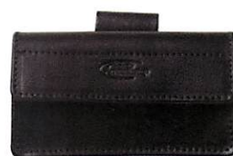
GR-050R パーツケース1 SIZE (約) H75×W130×D30mm JAN 4533707 80147 3