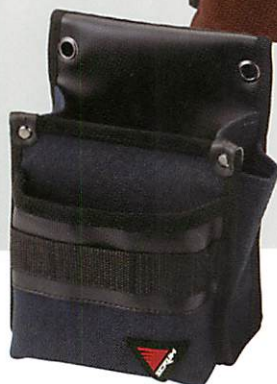
PKS-220 NG ネイビーグリーン JAN 4533707 60169 1