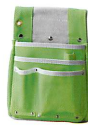
MKR-602 釘袋 仮枠 蛍光 GR SIZE (約) H340×W250mm JAN 4533707 50139 7