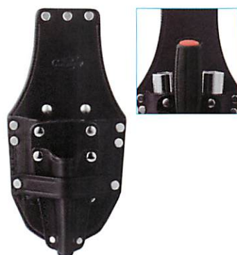
GR-014R 電ドルソケットドライバー SIZE (約) H220×W110×D65mm JAN 4533707 80145 9