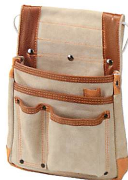
NO-872 デルマ床革 釘袋 大 SIZE (約) H340×W260mm JAN 4533707 50006 2