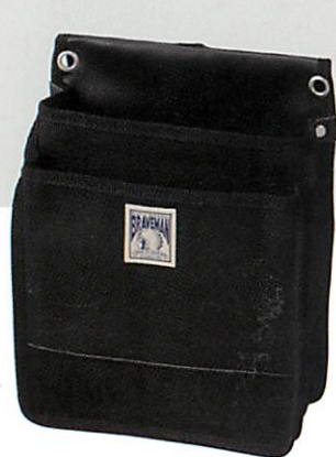
PKS-300S 電工用腰袋 2段 S SIZE (約) H235×W170×D100mm JAN 4533707 60178 3