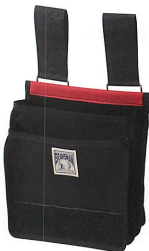
PKS-500S 電工用腰袋 2段 S バンドL SIZE (約) H320×W170×D95mm JAN 4533707 60182 0