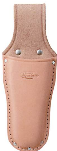
SL-31 ミゼットカッター差 SIZE (約) H230×W90×D35mm JAN 4533707 80063 6