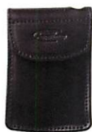
GR-051R パーツケース2 SIZE (約) H110×W75×D30mm JAN 4533707 80148 0