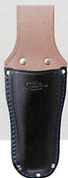
BL-31 ミゼットカッター差 SIZE(約)H230×W90×D35mm JAN 4533707 80050 6