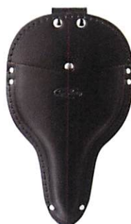
GR-031R 大久保鋏ケース SIZE (約) H230×W130×D35mm JAN 4533707 80150 3