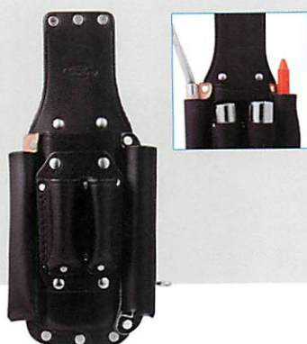
GR-011R 鉄筋4 電ドル2 SIZE (約) H280×W130×D65mm JAN 4533707 80142 8