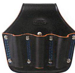
BL-83 ペンチ8吋3丁差 SIZE (約) H160×W170×D35mm JAN 4533707 80047 6