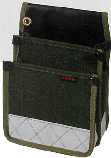
ケミカル防水電工袋 グリーン

SIZE (約) H270×W200×D125mm JAN 4533707 60001 4