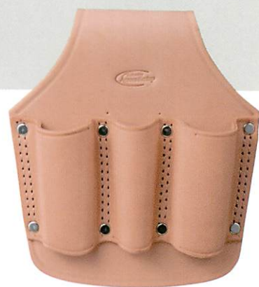
SL-83 ペンチ8吋3丁差 SIZE (約) H200×W180×D40mm JAN 4533707 80062 9