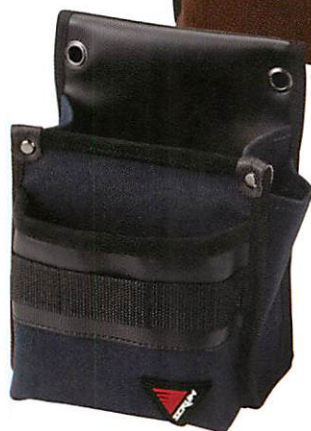
PKS-270 NG ネイビーグリーン JAN 4533707 60175 2