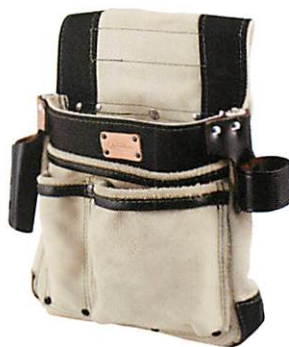
DM-06 デルマ革 釘袋 大 工具差付 SIZE (約) H330×W320mm JAN 4533707 50185 4