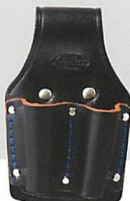
BL-72 ペンチ7吋2丁差 SIZE (約) H145×W95×D35mm JAN 4533707 80043 8