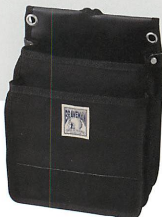
PKS-300M 電工用腰袋 2段 M SIZE (約) H270×W200×D100mm JAN 4533707 60179 0