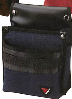
PKS-270 NB ネイビーブルー JAN 4533707 60174 5