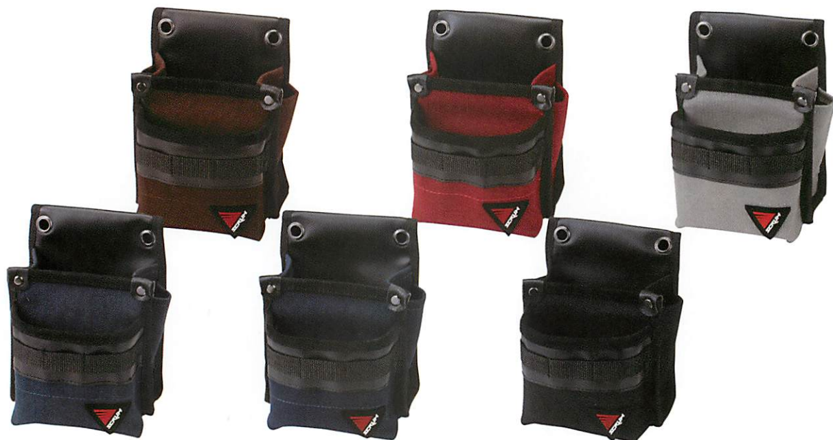
PKS-190 NG ネイビーグリーン JAN 4533707 60163 9