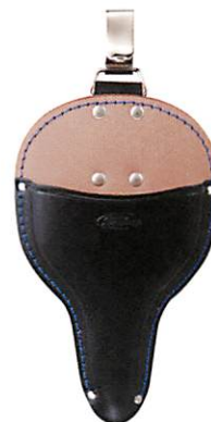
BLG-04 大久保鋏ケース カン付 SIZE(約)H285×W140×D30mm JAN 4533707 80059 9