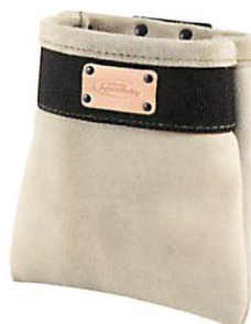
DM-20 デルマ革 万能ケース A SIZE (約) H190×W170mm JAN 4533707 50183 0