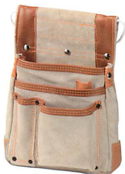
NO-871 デルマ床革 釘袋 小 SIZE (約) H310×W230mm JAN 4533707 50005 5