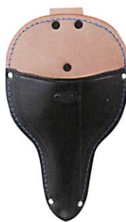
BLG-03 大久保鋏ケース SIZE(約)H230×W135×D30mm JAN 4533707 80058 2