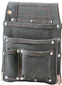
GK-105 釘袋 職人の選び SIZE (約) H370×W285mm JAN 4533707 50132 8