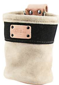
DM-12 デルマ革 小物ポケット S SIZE (約) H150×W110mm JAN 4533707 50182 3