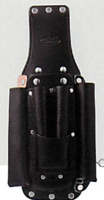
GR-013R 鉄筋5丁差 SIZE (約) H280×W130×D55mm JAN 4533707 80144 2