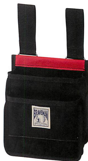
PKS-500M 電工用腰袋 2段 M バンドL SIZE (約) H365×W210×D100mm JAN 4533707 60183 7