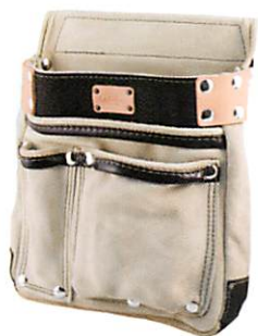
DM-04 デルマ革 釘袋 棟梁型 SIZE (約) H300×W250mm JAN 4533707 50178 6