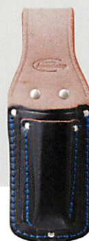
BL-33 カッターケース SIZE(約)H200×W70×D45mm JAN 4533707 80052 0