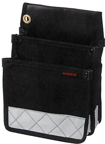
ケミカル防水電工袋 ブラック

SIZE (約) H270×W200×D125mm JAN 4533707 60001 4