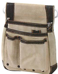
NO-874 デルマ床革 釘袋 棟梁型 SIZE (約) H280×W230mm JAN 4533707 50008 6