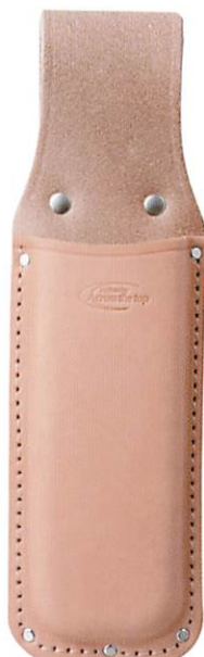
SL-32 万能ツール差 SIZE (約) H270×W85×D35mm JAN 4533707 80064 3