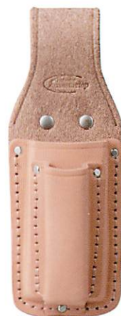
SL-33 カッターケース SIZE (約) H200×W70×D55mm JAN 4533707 80065 0

掲載されている写真のアイテム以外にも数百種のタイプがあります。詳しくはお問い合わせください。