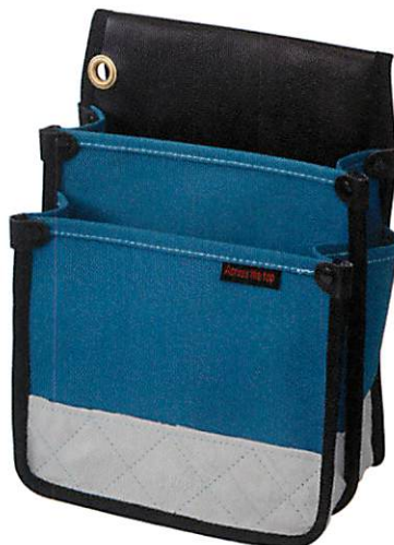
ケミカル防水電工袋 ブルー

SIZE (約) H270×W200×D125mm JAN 4533707 60002 1