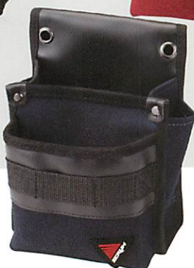
PKS-220 NB ネイビーブルー JAN 4533707 60168 4