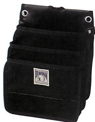
PKS-330M 電工用腰袋 3段 M SIZE (約) H270×W200×D130mm JAN 4533707 60181 3