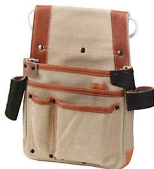
NO-873 デルマ床革 釘袋 工具差付 SIZE (約) H340×W310mm JAN 4533707 50007 9