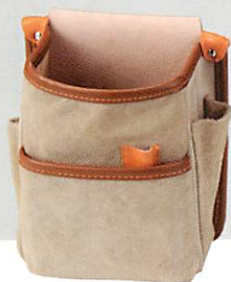
NO-201 デルマ床革 電工袋2段 SIZE (約) H230×W190×D120mm JAN 4533707 50001 7