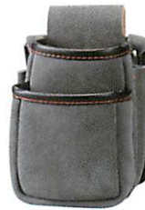
GK-202 電工袋2段 ミニ SIZE (約) H210×W140×D130mm JAN 4533707 50134 2