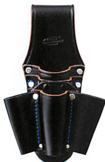
BL-85 ペンチ8吋5丁差 SIZE (約) H230×W145×D75mm JAN 4533707 80066 7