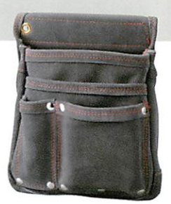
GK-104 釘袋 棟梁タイプ SIZE (約) H300×W250mm JAN 4533707 50131 1