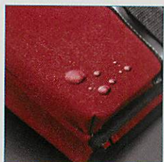
雨や汚れに強い!撥水コーティング。