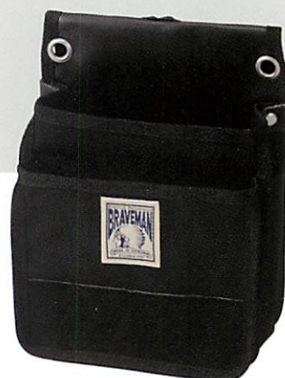
PKS-300L 電工用腰袋 2段 L SIZE (約) H300×W230×D110mm JAN 4533707 60180 6