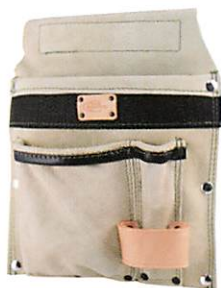
DM-05 デルマ革 釘袋 工具差付 SIZE (約) H290×W260mm JAN 4533707 50179 3