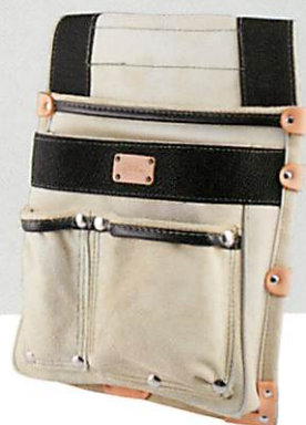
DM-03 デルマ革 仮杵釘袋 特大 SIZE (約) H380×W285mm JAN 4533707 50177 9