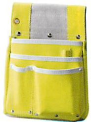
MKR-603 釘袋 仮枠 蛍光 YR SIZE (約) H340×W250mm JAN 4533707 50140 3