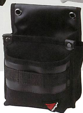
PKS-220 BK ブラック JAN 4533707 60170 7