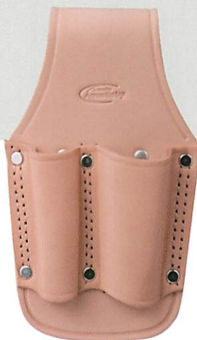
SL-82 ペンチ8吋2丁差 SIZE (約) H210×W125×D40mm JAN 4533707 80061 2