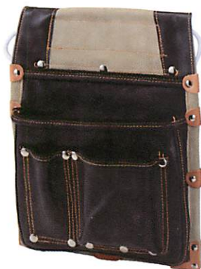
NO-752 黒エバー職人の選び SIZE (約) H375×W285mm JAN 4533707 50019 2