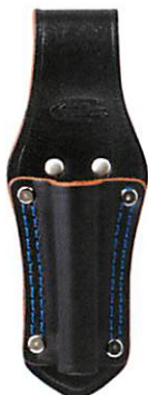
BL-81 ペンチ8吋1丁差 SIZE (約) H195×W70×D35mm JAN 4533707 80045 2