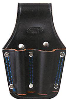
BL-82 ペンチ8吋2丁差 SIZE (約) H170×W115×D35mm JAN 4533707 80046 9