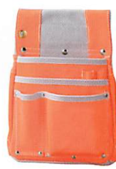
MKR-601 釘袋 仮枠 蛍光 OR SIZE (約) H340×W250mm JAN 4533707 50138 0