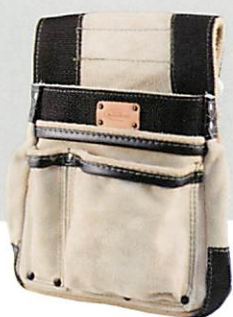
DM-01 デルマ革 釘袋 小 SIZE (約) H310×W230mm JAN 4533707 50175 5