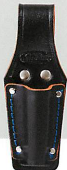
BL-71 ペンチ7吋1丁差 SIZE (約) H145×W60×D35mm JAN 4533707 80042 1