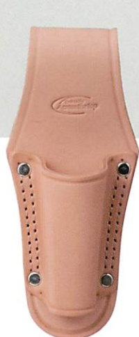
SL-81 ペンチ8吋1丁差 SIZE (約) H195×W85×D40mm JAN 4533707 80060 5