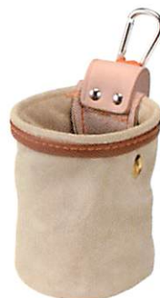
NO-100 デルマ床革 ポケット カラビナ付 SIZE (約) H170×W110×D110mm JAN 4533707 50020 8