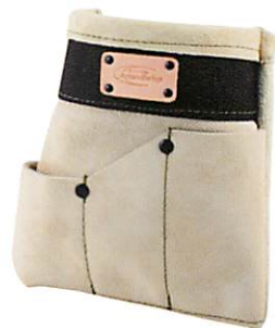
DM-21 デルマ革 万能ケース B SIZE (約) H190×W170mm JAN 4533707 50184 7