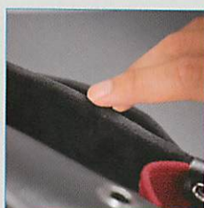
スエード調素材。素手にやさしい内貼。