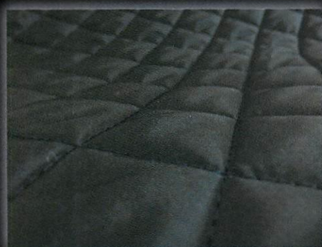
抗菌キルティング