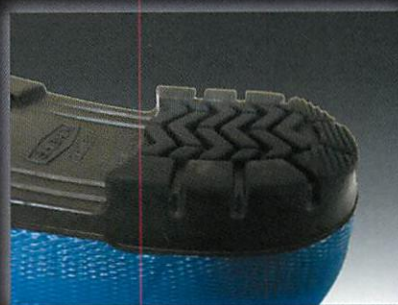
フォークリフトの運転に適した表底